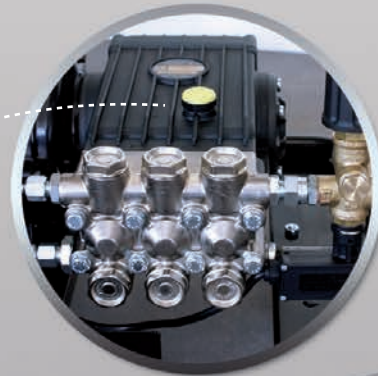
Langsam laufende Industriekurbel- wellenpumpe